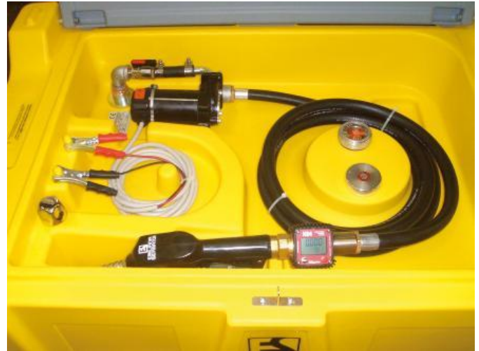
Pumpeneinheit mit Zapfpistole