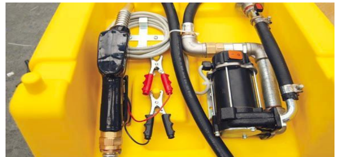
Pumpeneinheit mit Zapfpistole