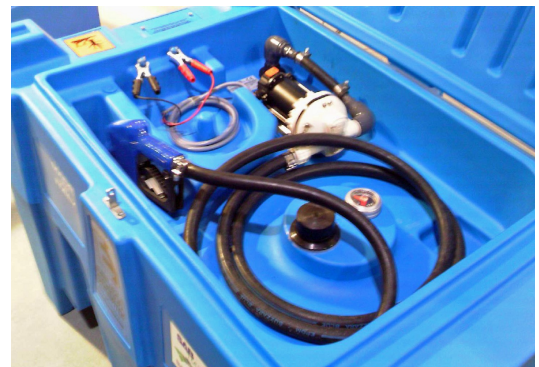
Pumpeneinheit mit Automatik-Zapfpistole