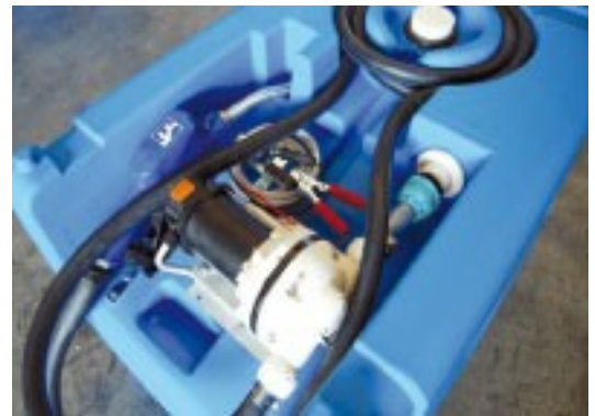
Pumpeneinheit mit Automatik-Zapfpistole